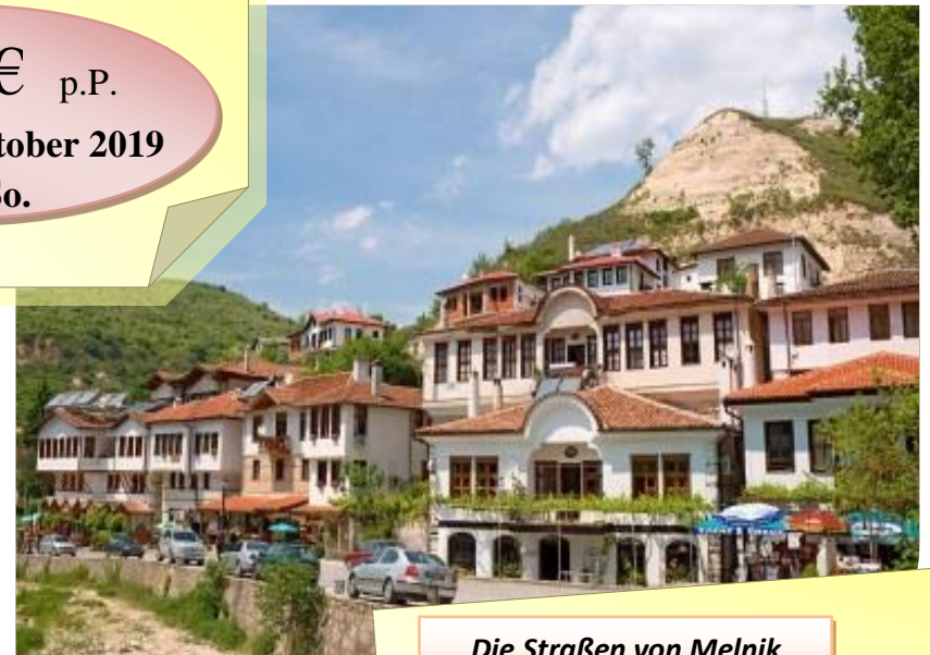
Die Straßen von Melnik